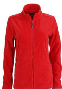
JN765/Jn 766 Basic Fleece Jacket S-3XL 22,95 € Klassikaline fliisjakk, püstine krae. Kergesti hooldatav anti-pilling microfliis. Kaks lukuga taskut. 100% polüester