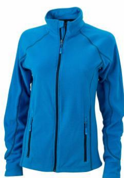
JN596/JN597 Structure Fleece Jacket S-3XL 20,32€ Kerge, meeldivalt pehme, kerge struktuuriga fliis. Lukuliistuga, kontrastsete õmblustega. 100% polüester