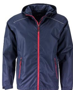
JN1117 / JN1118 Rain Jacket S-3XL 22,32 € Tuult ja vett pidav kerge jope (3,000 mm). Hingav. Õmblused on veekindlalt teibitud. Kontrastsed lukud. Väga praktiline. Kangas: 100% polyamide Vooder: 100% polyester