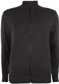
Hans 15 Meeste kardigan. Kõrge kaelus, ees lukk. 50% peen meriinovill 50% polüakrüül