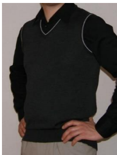
Kait 1 Meeste vest 50% peen meriinovill 50% polüakrüül