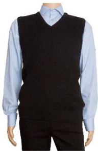
Kalev 7 Meeste vest 50% peen meriinovill 50% polüakrüül