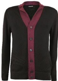
Vero 32 Meeste kardigan. Reväärkrae, taskute ja nööpidega. 50% peen meriinovill 50% polüakrüül