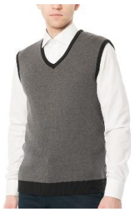
Martin 3 Meeste vest 50% peen meriinovill 50% polüakrüül

Norrison /Meeste Kudum Pildid on illustreerivad vaata lisa ERIDISAIN