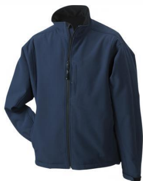
JN135 /JN137 Softshell Jacket S-3XL 32,95 € Trendikas softshell jope. Funktsionaalne 3-kihiline TPU membraaniga, tuulekindel, hingav ja veekindel materjal. Seest mikrofliisiga. Funktsionaalsete taskutega. 95% polyester, 5% elastane