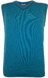
Kardo 2 Meeste vest. Paksemas koes 50% peen meriinovill 50% polüakrüül