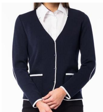
Marilin Naiste kardigan. Kontrastsete detailidega. 50% peen meriinovill 50% polüakrüül