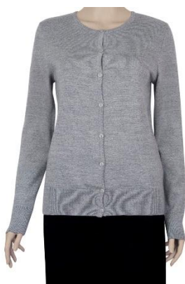
Sirpa Naiste kardigan. 50% peen meriinovill 50% polüakrüül