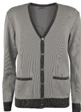
Martin 4 Meeste kardigan. Taskute kontrastsete detailidega, metallist nööpidega. 50% peen meriinovill 50% polüakrüül