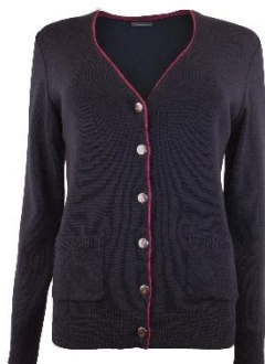
Vero 32 Naiste kardigan. 50% peen meriinovill 50% polüakrüül

Norrison / Naiste kudum vaata lisa ERIDISAIN