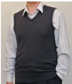
Kait 1 Meeste vest 50% peen meriinovill 50% polüakrüül